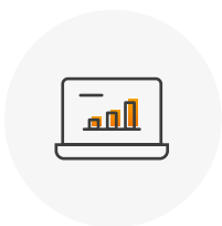
stand alone (infrastruktura klienta)