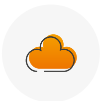
cloud (przeglądarka internetowa)